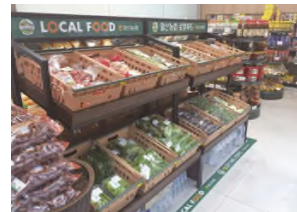
[그림 6] 국내 로컬푸드 매대

- [그림 7] 은 대형마트의 신선식품 코너 사례인데 행잉 타입 사인물과 적절한 조명으로 균형감 있는 실내 디자인을 보여줌. 소비자가 주로 이용하는 마트의 실내 디자인 수준을 고려한 경쟁력 있는 디자인을 하기 위해서는 신선함이 강조되는 색채와 조명의 이용은 필수이고 일반 마트 제품과는 차별되는 요소를 사인물로써 인지시킬 수 있어야 함.