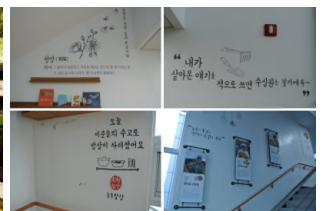
[그림 8] 대형마트 신선식품 매대 및 [그림 9] 청양 직판장 내부 사인물 패키지 디자인 사례

- [그림 9] 사인물 디자인은 고객 입장이 아닌 판매자 관점의 내용 및 표현인데 이는 바람직하지 못함. 매력없는 콘텐츠를 스토리텔링으로 포장한 사례.