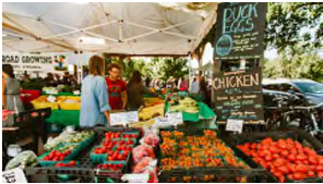
[그림 2] 파머스 마켓(Farmer's Market) 야외 매대

- 인근이 공원으로 둘러싸고 있으며 하천변의 개활지에서도 본 건물이 잘 보이므로 외부 공간의 활용을 적극적으로 할 필요가 있으며 외국의 로컬푸드 운동의 하나인 파머스 마켓과 [그림 2] 같은 외부 가판대의 분위기는 지역농산물의 밝고 건강한 이미지를 새기는데 유리한 방안임.