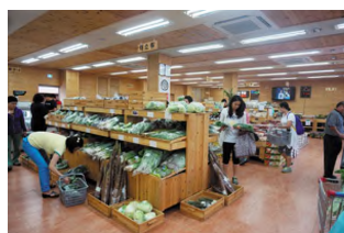
[그림 5] 완주군 용진농협 로컬푸드 직매장 사례

- 완주군 로컬푸드 직매장 역시 조명 방식은 유사하지만 명도가 높아서 좀 더 생기가 있으며 바닥과 벽 천장 모두 난색 계열의 재료를 사용하여 색채의 일체감과 밝고 따뜻한 분위기를 만들고 있음.