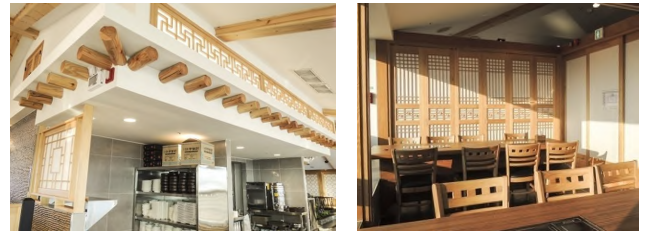
[그림 14] 한옥 처마 모티브와 창살 장 식 [그림 15] 문살과 의자의 패턴 식