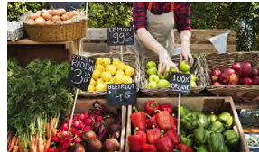
[그림 3] 자연 친화 이미지를 갖는 디스플레이

- 야외 공간에서 자연 소재의 용기와 초크 사인의 사용은 건강하고 인간적인 느낌을 전달함. [그림3] - 화려한 식재료의 자연색을 최대한 돋보이게 디스플레이한 것을 볼 수 있음.