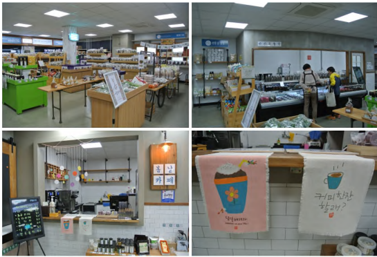
[그림 11] 청양 농부 마켓, 농부밥상