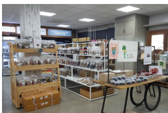
[그림 4] 청양 농부마켓 실내 사례

- 청양 농부 마켓은 원목 매대와 흰색 프레임 매대를 사용하였는데 비닐로 포장된 제품이 포장에 신선한 느낌을 주지 않고 있으며 일반 마트 제품과의 시각적 차별화가 없음. - 조명은 사무실 조명과 같은 전반조명을 사용하여 창백한 인상을 주고 있는데 부분조명의 이용과 조명 색온도 조절을 통한 분위기 개선이 필요함.