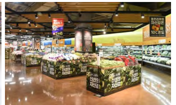
[그림 7] 대형마트 신선식품 매대 사례

- 패키지 디자인에 있어서도 경쟁관계에 있는 마트의 신선식품 포장을 분석하여 경쟁력있는 VMD 개념의 디스플레이를 고려해야 함.