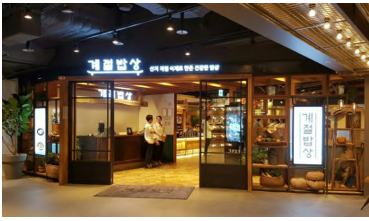
[그림 10] 식당 입구 디자인(계절 밥상) 사례