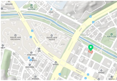
[그림 1] 대상지 주변

- 인근이 공원으로 둘러싸고 있으며 하천변의 개활지에서도 본 건물이 잘 보이므로 외부 공간의 활용을 적극적으로 할 필요가 있으며 외국의 로컬푸드 운동의 하나인 파머스 마켓과 [그림 2] 같은 외부 가판대의 분위기는 지역농산물의 밝고 건강한 이미지를 새기는데 유리한 방안임.