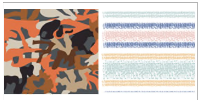
[그림 3] 한글 자음을 추상적으로 활용한 패턴 1 [그림 4] 한글 자음을 추상적으로 활용한 패턴 2