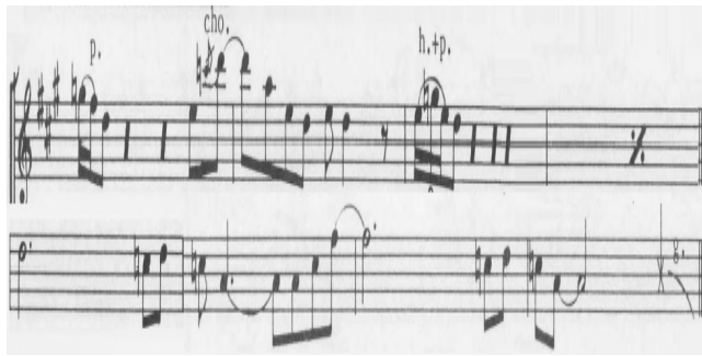
[그림 5] Ionian Scale

는 Mode 음악으로 다른 Key에서 조성을 빌려오게 되는 Modal Interchange로 해석된다. 재즈, 팝 음악에서 많이 사용된다. 드물게 락 에서 사용되는 경우 이를 프로그레시브 락, 메탈이라 한다. 4도 Major에서 이전까지는 D Minor Pentatonic Scale을 사용했지만 D Ionian Scale이 사용되어 2도가 나오게 된다. 6도는 Avoid Note로 8분음표 이상 쓰면 코드와 부딪치지만 8분음표 길이 안에서는 경과음으로 쓰이게 된다.반음계의 크로메틱 어프로치 노트도 자주 사용된다. Tension Note 13th에서 5도 Chord Note로 이어지는 과정은 불안정한 Tension Note 긴장감을 풀어주는 Tension Resolve로 해석된다. 이러한 Voicing은 Jazz 연주에서 자주 보이며 단순한 Chord에서 탈피하여 다채로운 색채를 더하게 된다. Jimmy Page는 Jazz Improvisation으로 Rock 음악의 다채로운 색감을 표현하고 있다. 해머링 온, 플링 오프, 밴딩, 업, 다운 주법을 사용하여 일렉기타 에서만 쓸 수 있는 줄을 올리고 내리는테크닉을 사용하고 있다. 이는 연속되는 음을 더 부드럽게 연주 가능하게 된다.