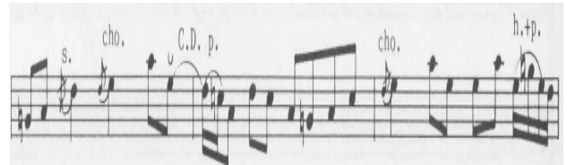
[그림 3] Diminished Scale

를 사용하여 반음씩 상행하고 있는 이유로 크게 2가지 해석을 할 수 있다. 첫 번째는 반음계적으로 접근한다는 뜻의 Chromatic Approach로 이 경우 Key가 바뀌지 않는 경과음으로 해석 가능하나 b7도(G#), 2도(B)가 들어가서 A Diminished Scale이 사용됨을 알 수 있다. 디미니쉬드 단3도로 상행 또는 하행하여 연주하면 같은 구성음이지만 음의 높이가 달라지는 특징을 보인다. 하지만 전체적인 음은 같으므로 연속해서 루트를 바꿔 연주하는 경우가 많다.