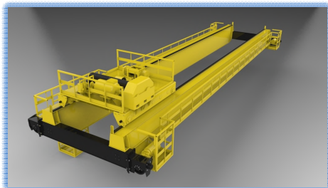
[그림 1] Rail is laid on the run way girder, and a beam that runs at right angles is installed on this rail.

천정 크레인은 산업현장의 크레인 중에서 가장 많이 사용되는 것으로, 공장 내의 벽을 따라 런 웨이 거더(run way girder)위에 레일(rail)을 부설하고, 이 레일에 직각으로 주행하는 빔을 걸친다. 이 빔에 권양(hoisting) 및 횡행(traversing)장치를 갖는 트롤리(trolley)가 부설되어 트롤리로부터 훅(hook)을 내려서 중량물을 취급한다.