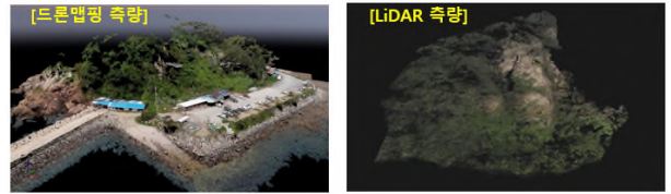
[그림 2] 드론맵핑 점군자료(좌)와 LidAR 측량 점군자료(우)