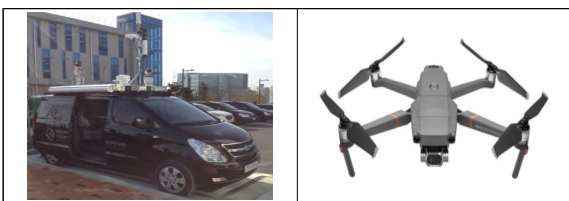
[그림 1] LidAR 탑재 조사 차량과 드론(Mavic 2)

연구 대상 사면의 정밀하고 정량적인 지질학적 분석을 위해 특수조사 차량에 탑재된 RIEGL사의 VZ-2000로 대상지역을 LiDAR 스캐닝하였다. 사면의 형태와 분포 양상을 고려하여 아리랑지구는 4개, 마도지구는 5개의 스캔 지점을 계획하여 사면의 3차원 점군 자료를 취득하였다. 취득된 점군 자료에서 노이즈 필터링을 통해 사면 주변의 수목과 잡풀, 낙석방지 울타리 등을 제거한 후 사면의 암반 점군 자료로부터 정밀한 사면의 DEM 자료를 취득하였다.