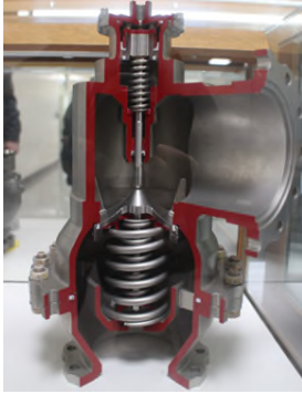
[그림 1] 우주발사체용 개폐밸브의 포핏 구조