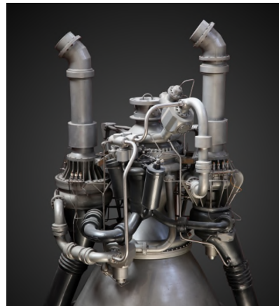
[그림 5] 연소기 배관 하우징 (Arian Space 제공)

연소기용 배관은 산화제 개폐밸브는 엔진에 극저온의 액체의 산화제를 공급하기 위한 밸브이며 적층제조법으로 인코넬 718 분말을 사용하여 제조할 예정이다. 중량은 1.2kg 정도이며 제품의 치수는 대략 10x10x100mm 정도이다. 요구 유량은 3kg/s, 차압은 최대 10Bar 이하이다. 작동 내구성 확인을 위하여 약 10회 정도의 시험을 실시할 예정이다.