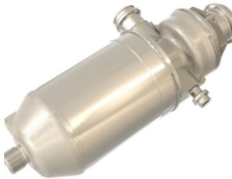
[그림 2] 소형 우주발사체용 산화제 개폐밸브