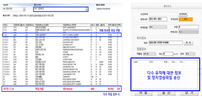
(a) 자료항목 (b) GUI [그림 2] 전문 전송 향상 방안 : 첩보보고(K04.1)