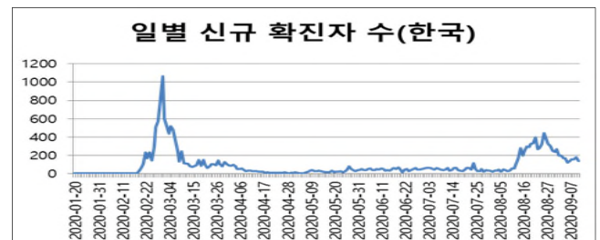
[그림 1] 일별 신규 확진자 수(한국, 질병관리청 기준)

코로나19의 경우 무증상 감염을 통해 확산되는 경우가 많아 코로나 검사 결과 양성으로 나오는 확진자를 최대한 찾아내고 접촉자를 추적하여 감염 경로를 차단하는 것이 매우 중요하다. 먼저 현재까지의 코로나19의 확산 속도를 확인하기 위해 확진자 수에 대한 통계를 정리하였다. 한국의 경우 질병관리청(KDCA: Korea Disease Control and Prevention Agency)에서 발표한 자료를 기반으로 일별 신규 확진자 수를 파악하였다. [그림 1]을 보면 신규 확진자 수는 3월 1일 1,062명(2월 29일 16:00 ~ 3월 1일 24:00 집계)으로 최대를 기록하였고, 8월 26일 441명으로 2차 피크를 보였다.