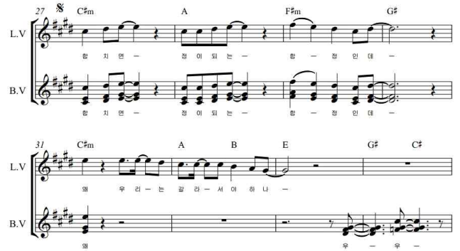
[그림 3] 합정역 5번 출구 27~34마디

위 [그림 3]을 보면 27부터 31마디까지 리드 보컬과 함께 주선율을 연주해주고 있는데 주선율을 1옥타브 밑으로도 연주해주는 유니즌 형태로 연주하며 이는 주선율을 더욱 풍성하고 강조되게 하는 효과를 주었다. 코드진행에 맞게 주선율 위로만 화음을 쌓아 연주하였는데 화음을 많이 넣지 않음으로써 필요한 느낌을 충족 하였다. 리드 보컬과 같이 주선율을 연주 해줌으로써 리드 보컬의 연주를 보다 안정적으로 만들어주는 효과를 주었다.