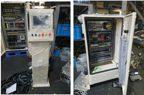
[그림 7] 기계구동장치 및 제어장치

프레임의 구동장치의 경제적인 요소와 형태를 고려하여 표준적인 규격을 사용하여 제작하였으며, 용이한 조립을 위하여 프레임 연결은 모터 구동시 흔들림을 방지하기 위해 파이프 형강으로 보강하였다. [5]