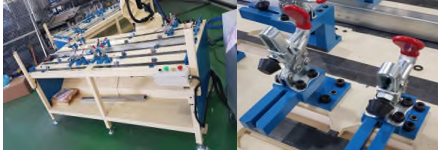
[그림 5] 자동용접로봇 예시

고장수리(Troubleshooting)가 용이하도록 개발하고, 본체와 제어기에서 발생하는 에러코드를 띄우고, 각 에러코드에 맞게 고장수리 진행 한다. 주요 Troubleshooting 동작영역 이탈시 복구하며, 로봇 동작 영역 이탈시 복구하고 구동장치를 교체하여 점검한다. 과전압 점검은 모터 구동 서보 구동장치 전압 설정치 초과 시 발생 재생속도 에러 발생 점검 하고 로봇의 급격한 감속, 중력방향으로 빠른 속도 하강 등 메인보드, 서보보드, 터치펜던트 점검과 케이블, 통신을 점검한다.