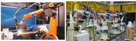
[그림 2] 산업용 로봇 예시

산업용 로봇 중 용접 로봇은 크게 스폿 용접 로봇, 아크 용접로봇, 레이저 용접 로봇 및 그 외 기타 용접용 로봇 등이 있으며, 로봇에 입력 정보를 교시하는 방법에 따라서는 용접 순서, 위치 등의 정보를 수치에 의해서 지령하는 수치 제어 로봇을 비롯해 미리 용접 순서나 위치 등의 정보를 기억시켜두는 플레이백 로봇, 용접선을 따라가는 것을 목적으로 하는 센서 부착 로봇 등이 있다.