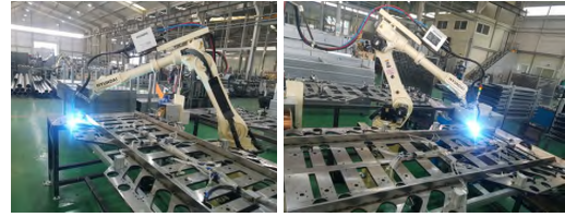
[그림 8] 용접공정 자동화 로봇

본 펜스제작을 위한 용접공정 자동화 로봇에서 설계된 기계 및 제어장치를 구동함으로써 용접자동화 시스템의 성능을 시험하고자 한다. 용접공정 자동화 로봇의 성능은 용접하고자 하는 형상과 실제 장치를 발생시키는 형상과 어느 정도 일치하는가에 달려있다.