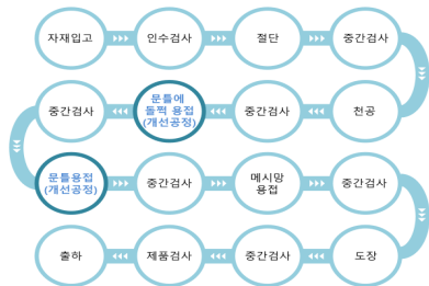
[그림 6] 용접공정 프로세스 예시

아래의 프로세스에서 문주방향 프레임에 돌쩌귀를 용접하는 부분과 각 프레임에서 맞는 부분을 용접할 때는 반대편 각 프레임 용접은 수작업에서 자동로봇으로 대체할 수 있어 품질 향상과 제작시간이 절감되어 업무의 효율성을 높일 수 있다.