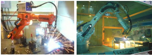
[그림 1] 자동 용접로봇기 예시

대표적인 용접공정 자동화 로봇의 주요한 기술인 용접 로봇은 말 그대로 용접시 사용되는 산업용 로봇을 말하며, 산업용 로봇은 자동 제어 기술에 의한 매니플레이터 조작 또는 이동기능을 가지고 있어, 여러 가지 종류의 작업을 프로그래밍에 의해 실행할 수 있어 산업에 사용되는 기계를 뜻하며, IFR(International Federation of Robotics)에서는 고정 또는 움직이는 것으로 산업 자동화 분야에 사용되며 자동제어, 제어프로그램, 다목적인 3축 또는 그 이상의 축을 가진 자동 조정 장치로 규정하고 있다. [2]