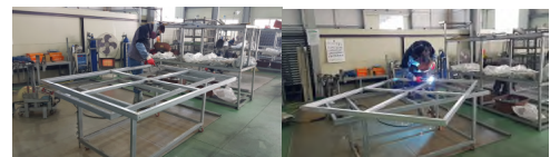
[그림 4] 용접작업 현황 예시

로봇전용 용접 테이블 개발은 기존 단순 작업테이블에서 로봇이 안정적으로 생산할 수 있는 시스템 적용을 위한 맞춤형 용접테이블을 구축하고 5가지 제품규격(0.9, 1.2, 1.5, 1.8, 2.0, 단위 m)에 모두 적용 되도록 고정용 클램프를 배치하여 고정 작업 효율을 극대화 하고, 상·하 회전 시 움직임이 없도록 단단히 고정 시킨다. [3]