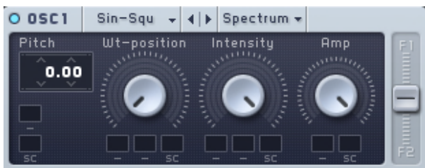
<그림 3 Massive의 OSC1 화면 >

위의 <그림 3>은 808 Bass 사운드 메이킹을 하기 위하여 똑같이 Sine 파형을 불러온 Massive OSC1 화면이다. 선택한 프리셋은 Basic 에 있는 Sine-Square이며 이것은 파형이 1 개가 아니라 2 개를 하나로 묶은 형태이므로 Massive 에서 단독적인 Sine 프리셋을 필요로 하지 않는다. OSC 의 Wt-Position 노브를 좌측 끝으로 두게 되면 Sine 파형이 되고 우측 끝으로 두게 되면 Square 파형이 된다. Serum