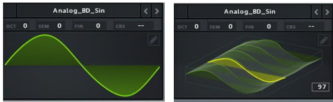
<그림 2 2D 단일사이클 웨이브(좌) 최대 256 개의 서브 테이블 3D(우) 화면>

웨이브 테이블은 최대 256개의 서브 테이블과 단일 사이클 웨이브로 구성되며 일반적인 상황에서는 한번에 256개의 테이블 중 하나를 듣지만, WT Pos 노브를 이용하여 오토메이트 시켜 256개의 소리를 모두 들을 수도 있다. 또한 <그림 2>에서와 같이 단일사이클 웨이브를 2D로 볼 수가 있고 256개의 서브 테이블을 한꺼번에 볼 수 있도록 3D로 표현하였으며 이는 사운드 메이킹시 다른 악기처럼 귀로만 메이킹하는 것이 아니라 귀와 눈 동시에 사운드 메이킹을 할 수 있다는 최대 장점일 것이다.