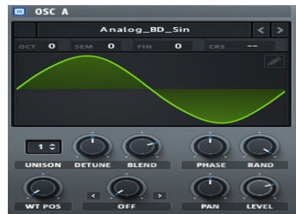
<그림 1 Serum의 OSC A 단일사이클 웨이브 화면>