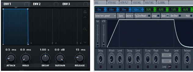
[그림 5] Serum 엔벨로프화면(좌) Massive 엔벨로프화면(우)

<그림 5> 에서 Massive 의 엔벨로프 그래프는 Decay 구간이 없고 Attack, Sustain, Release 구간이 확연하게 보이지만 Serum 엔벨로프에서는 Decay 와 Release 구간이 없는 것을 볼 수가 있다. 기본적인 Attack, Decay, Sustain, Release 4개의 노브는 갖추고 있으나 기본 엔벨로프 그래프가 다르기 때문에 베이스 사운드를 만들기 위하여 Serum 엔벨로프에서는 Sustain 노브를 조절하여 db를 낮춰주고 Release 노브는 MS기 때문에 곡에 맞게 적당히 조절한다. Massive 엔벨로프에서는 Sustain 노브 대신에 Decay에 관한 Level 노브를 조절하여준다. 이때 역시 Massive에서는 노브 조절 시 수치가 나오지 않기 때문에 귀로 들으면서 변화되는 그래프를 관찰하여야 한다. Massive에서는 총 3개의 soc을 사용할 수 있지만, Serum에서는 총 2개의 OSC가 있기 때문에 소리를 강화 시킬 시 OSC B를 추가시켜도 되고 저음을 추가로 부스터 시키는 SUB 화면이 있어 원하는 파형을 보고 편리하게 소리를 추가시킬 수 있는 장점이 있다.