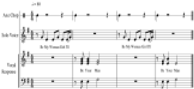
[Fig 1] Rosie Sheet Music

알란 로맥스(Alan Lomax) - Rosie(1947)는 아프리카 아메리칸(Afro-American) 노동요로 1930년대 초 알란 로맥스가 외부 세계에 닿지 않은 노래를 찾고 있던 도중 남부 교도소를 찾게 되었을 때 만들어진 곡으로 파치만 팜(Parchman Farm)으로 알려진 미시시피 주 교도소에서 수감자들이 작업시에 부르던 콜앤 리스폰스(Call & Response) 형식의 노동요이다. 곡에 등장하는 리듬은 도끼와 같은 작업용 도구들을 이용하여 만들어낸 소리이며 발표되기까지 10년의 시간이 걸렸다. “Rosie”는 특정한 인물이 아닌 가혹한 구타와 잔인한 폭력에서 벗어나 석방되고 싶은 수감자들의 자유와 갈망, 감옥 밖에서의 삶에 대한 동경, 희망 등을 상징적 의미의 “Rosie”라는 여인으로 빗대어 표현하였다. 또 다른 측면으로는 영적인 의미로의 신을 표현 하며 오직 신만이 이 고통을 끝낼 수 있다 라는 의미를 내포하기도 하고 Rosie의 품에서 행복하고 평온한 날들을 꿈꾸는 것 처럼 신의 품에서 행복하길 바라는 마음과 이번 생은 아니더라도 다음 생엔 자유가 있을 것이라는 의미를 내포한다.