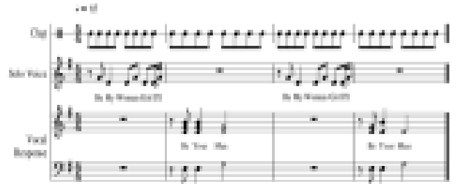
[Fig 2] Hey Mama Intro Sheet Music

David Guetta (Feat. Nicki Minaj, Bebe Rexha & Afrojack) - Hey Mama는 2014년에 발매 된 앨범으로 인트로(Intro)와 인털루드(Interlude), 아웃트로(Outro) 모두 16마디 구조를 가지고 있고 “Rosie”의 첫 8마디 가사를 샘플링 하여 만들었다.