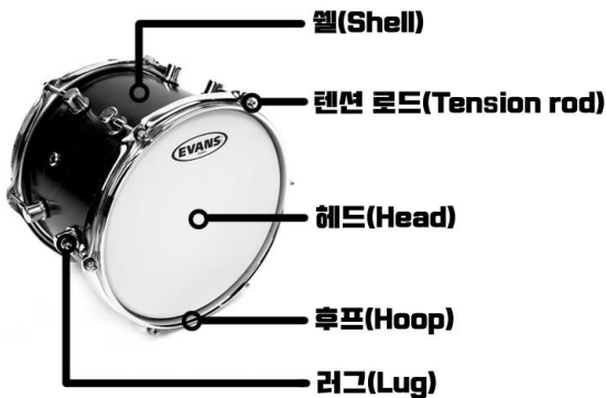
<그림 1. 일반적인 드럼의 구조>