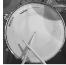
<그림 6. 스틱 샷>

스틱 샷은 스틱 하나를 헤드에 붙이고 나머지 스틱 하나로 헤드에 붙인 스틱을 치는 연주 기법이다. 주로 재즈에서 연주하며 스틱 고유의 소리를 강조하거나 악센트를 줄 때 사용한다.