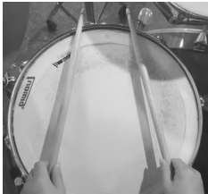
<그림 5. 림 클릭>

스네어 드럼의 림만을 연주하는 기법이다. 림 고유의 쇳소리나 나무소리를 내어 음악에서 변화를 줄