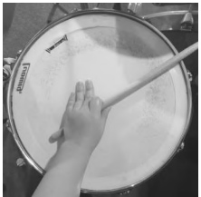
<그림 4. 크로스 스틱>

스틱을 스네어 드럼 헤드와 림에 붙이고 림을 스틱으로 치는 연주 기법으로 사이드 스틱이라고도 한다. 밝은 톤의 전혀 다른 음색으로 발라드나 보사노바와 같은 라틴음악에서 주로 쓰인다.