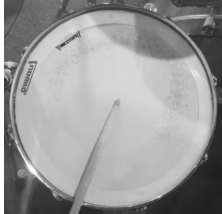
<그림 3. 림 샷>

림 샷에는 오픈, 클로즈 두 종류가 있다. 오픈 림 샷은 드러머 진 크루파가 발명한 것으로 알려져 있으며, 음악의 백 비트를 더 강조되게 표현하기 위해 헤드와 림을 동시 타격함으로써 강한 악센트를 만들어 주는 기법이다. 강한 소리를 만들어야 하는 록과 메탈 음악에서 주로 쓰인다. 클로즈 림 샷은 스틱을 스네어 드럼 헤드와 림에 붙이고 림을 스틱으로 치는 연주 기법이며 크로스 스틱으로도 불린다.