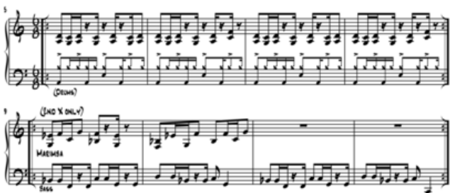
<그림 7 - Savanna's Music Sheet>

1997년 작품으로 Blue Hat 앨범 수록곡으로, Blue Hat은 빌보드 차트 재즈 차트에서 9위에 올랐던 앨범이다. 드럼 키, 하이햇과 베이스 기타, Xylophone이 각기 다른 Time Signiture를 두고 연주하듯 느껴진다. 이는 타악기 뿐 아니라 연주파트 전반에 걸쳐 폴리틱 요소가 보여지는 것을 말한다. 이런 특징은 같은 앨범 수록곡인 Capetown에서 역시 보여지고 있으며 두 곡 모두 아프리카 지역을 연상시키는 제목을 가지고 있다.