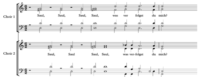
<그림 2 - Example of Call & Responce >