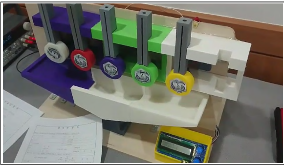
[그림 2] 개발된 시스템 및 동작 확인 테스트 모습

바코드 정보를 읽는 앱은 앱인벤터를 이용하여 제작하였고 [3], 실험을 위해 만든 가상의 처방전에 기록되는 바코드의 정보는 7자리 숫자이며 앞 2자리는 처방전 번호, 뒤 5자리는 약품 조제 코드로 작성하였다. 약품 조제 코드는 0과 1의 숫자로 표시되며, 해당 자리의 숫자가 1이면 조제 시 해당 자리의 약을 투입하고 0일 경우 투입하지 않도록 하였다.