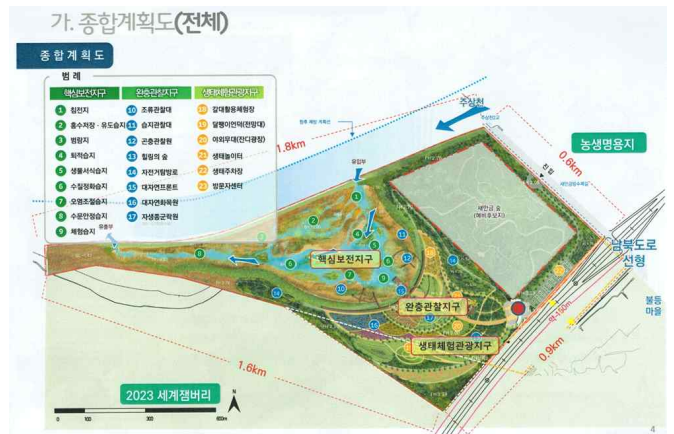
[그림 1] 새만금 환경생태용지 조성사업 종합계획도(전북지방환경청, 2017)

새만금 환경생태용지 인근 관광지별 연간 입장객 수는 대명리조트변산아쿠아월드, 영상테마파크 등 연 59만명, 변산반도, 새만금전시관, 청림청소년수련시설 등 연 144만명, 아리랑문학마을, 벽골제관광지, 모악산도립공원 등 연 115만명이다(전북지방환경청, 2017). 인근 관광지별 연간 입장객 수를 고려하여 새만금 환경생태용지 조성사업(1단계)의 연 관광객 수를 50만명으로 가정하여 경제성분석을 진행하였다.