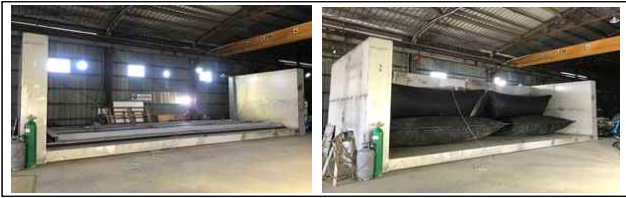
[그림 2] 직립형 고무보 기술(도복 및 기립시 작동)

본 연구진은 하천이나 저수지에서 용수 확보 및 수위 조절을 위한 고무보 및 직립형 고무보 기술을 보유하고 있다.