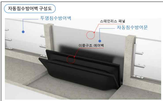
[그림 3] 자동침수방어벽 기술 구성도