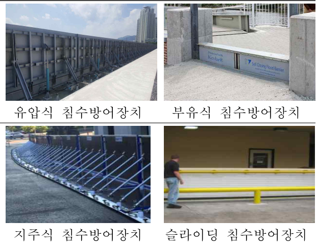
[그림 1] 침수방어장치 사례

수관, 침수벽 등) 현황을 조사하여 기술적 특징 및 장단점을 도출하여 본 연구에 활용할 수 있도록 하였다.