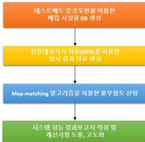
[그림 3] 검증시스템 정확도 산정 과정

[그림 3]은 성능검증 절차를 나타낸 것으로 입력은 준공도면과 탐사결과이며, 출력은 결과보고서이다.