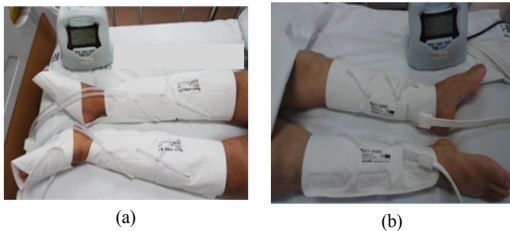
Fig. 2. Cuff types of IPC (a) Boots type (b) Calf type

간헐적 공기압박기(IPC)는 제품명 사지 압박순환장치 (DVT-3000, (주)대성마리프 제조, Korea)로 주기적으로 슬리브를 부풀려 사지를 압박하는 기구로 대퇴형, 무릎형, 부츠형 커프를 바꿔가며 사용 할 수 있는 기구이다 (Figure 2).