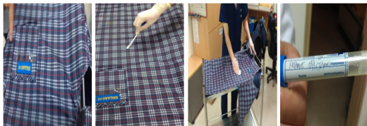
Fig. 1. Smearing of bacterial on apron

병원균의 종류 및 균락 수 측정은 방사선 차폐용 납 가운에 대하여 가로20 cm, 세로20 cm의 동일한 범위에서 swab으로 채취(Fig. 1)하여 위에서 설명한 배양법 및 실험방법으로 진행 하였고 각 검사실별 검출된 병원균의 종류와 균수를 통계분석 하였다.