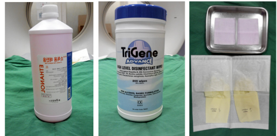
Fig. 2. 70% Ethanol for disinfection and disinfection wipe and of disinfection set

2)을 착용 후 고준위 표면 소독에 이용되는 소독용 티슈(Wipes, Trigene Advance Wipes; Alkyl Dimethyl Benzyl Ammonium Chloride, Didecyl Dimethyl Ammonium Chloride<1%, Poly (hexamethylene biguanide) Hydrochloride <1%)를 이용하여 오염된 납 가운을 소독 후 잔류 병원균의 종류와 균락수를 측정하고 통계분석 하였다.