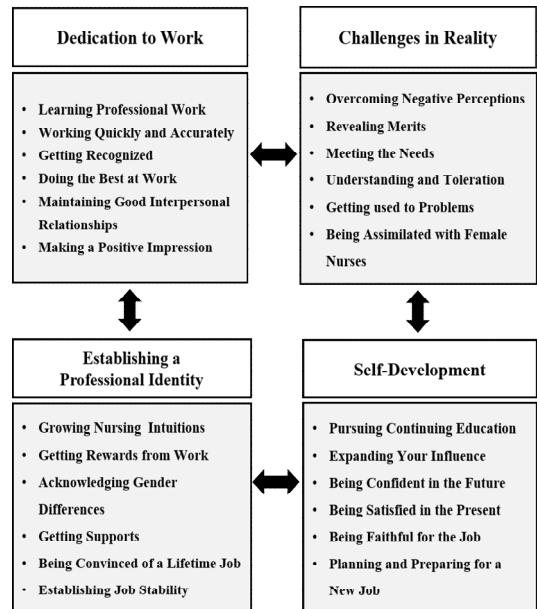
Fig. 1. General structure of the adaptation experiences of male nurses in clinical nursing settings

고립감 등의 다양한 어려움을 경험하였다. 따라서 주변 사람들에게 긍정적인 이미지를 각인시키고 능력을 입증받기 위하여 ‘주어진 업무에 열중하고 전념’하게 되는 적응 과정으로 드러나고 있다. 이러한 노력에도 불구하고 여성 동료들로부터 자신이 배제되고 불합리한 대우 및 편견적 시선 등 부정적인 현실에 봉착하면서 ‘기대와는 다른 현실에 적극적으로 도전’하는 과정을 경험하였다. 이러한 적극적인 도전을 통하여 편견적 시선을 이해하고 견디면서 간호직관을 다지고 직업의 안정성을 찾아가는 ‘직업적 정체성 확립’의 과정을 경험한다. 이러한 경험을 통하여 ‘자신의 미래를 위한 자기개발 노력’으로 이어지는 긍정적 적응 과정을 거치고 있다. 그러나 이러한 노력에도 불구하고 자신의 위치를 안정적으로 확보하지 못하고 방황하게 되는 경우 이직을 구상하고 있는 것으로 나타났다.