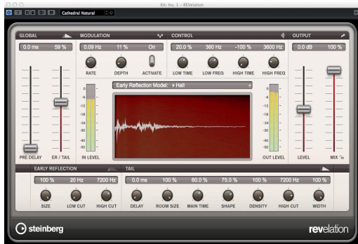
Fig. 2. Steinberg Cubase Revelation