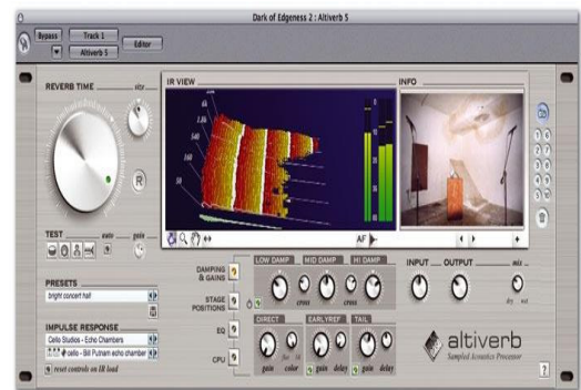
Fig. 4. Audioease Altiverb