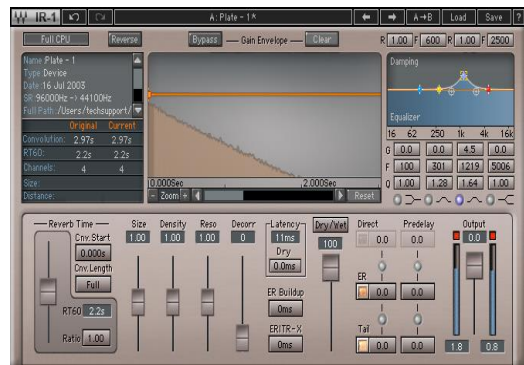
Fig. 3. Waves IR Live

대표적 모델로는 Waves IR Live, Audioease Altiverb 등이 있다.