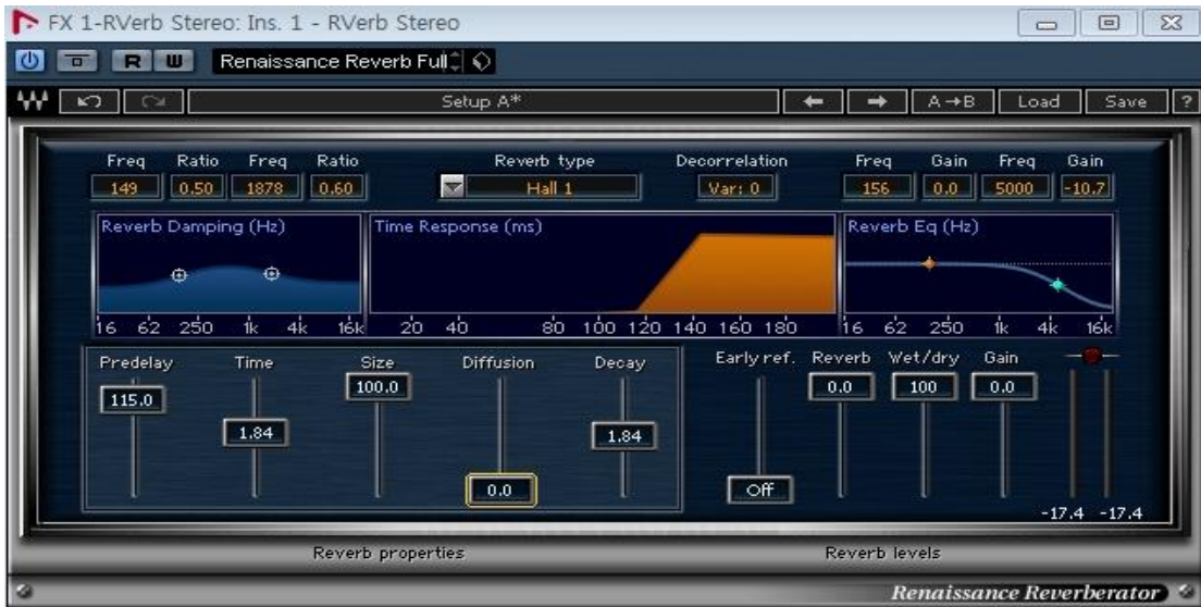
Fig. 5. Wave Renaissance Reverb

m) EQ Controls는 Reverb 인서트 채널에 직접 4Band EQ 이상의 EQ로 인서트해서 사용하는 편이 더욱더 효과적이고 세밀하기 때문에 거의 사용빈도수가 높지 않다.