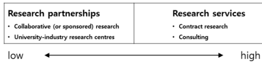
Fig. 2. Degrees of finalisation in industry-funded research[9]

관계강도(Relationship intensity) : Perkmann & Walsh(2007)[9]은, 관계(Relationship) 기반의 산과 학간의 링크(link)에 대한 연구에서, 최종목표수준의 높고 낮음을 기준으로 Fig. 2에 나타난 것처럼 ‘연구 서비스(Research services)’와 ‘연구 동반관계(Research partnerships)’로 구분하였다. 여기서 최종목표수준의 개념은 기업이 자신을 위한 연구가 새로운 지식을 얻는 것과는 대조적으로 기술적, 사회적 또는 경제적 목적을 추구하는 정도를 의미한다[10].