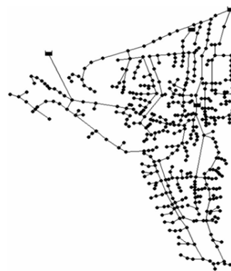
Fig. 3. Layout of Balerna network

관망의 설계에 사용되는 상업용 관의 경우 그 관경과 비용 사이의 관계가 비선형성을 나타내고, 수리해석 과정에 포함되는 요소 중 각 관로에서 흐르는 유량과 손실 수두를 산정하는 에너지 방정식의 경우에도 비선형성을 갖는다. 실제 상수도 관망의 경우 매우 방대한 경우의 수에 해당하는 가능 설계안이 존재하며, 각 관로에 흐르는 유량의 방향 또한 유동적이기 때문에 최적설계 과정에 어려움을 지닌다. 이에 다양한 메타휴리스틱 최적화 알고리즘들이 상수도 관망의 최적설계 문제에 적용되고 있다 [12-16].