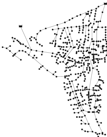
Fig. 2. Balerma network [22]

본 연구에서는 스페인에 위치하고 있는 농업용 상수도 관망인 Balerma network에 모방 화음탐색법을 적용하였다. Balerma network는 Reza와 Martinez [22]에 의해 처음 제시되었으며, 총 4개의 저수지, 454개의 관로, 443개의 수요절점으로 구성되어 있다 (Figure. 2). 해당 상수도관망 최적설계 적용문제가 소개된 이후, 다양한 알고리즘들이 총 모의횟수를 45,400회로 동일한 종결조건으로 최적 설계안을 제시하여 결과를 비교하고 있다.