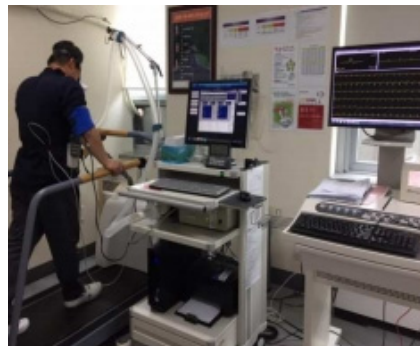
Fig. 2. Cardiopulmonary exercise test

이후 재활의학과 외래에 내원하여 수정된 브루스 프로토콜(modified Bruce protocol)을 이용한 증상제한(symptom limited) 운동부하검사 및 호흡가스분석을 시행하였다(Fig. 2). 검사는 12채널 실시간 운동부하검사용 심전도 검사기 (Quinton Q-stress, Mortara Instrument, INC, USA) 및 운동부하검사용 트레드밀 (Q-stress TM55, Mortara Instrument, INC, USA), 자동 혈압 및 맥박 측정기 (247BP, SunTech Medical, USA), 호흡가스 분석기(TrueOne 2400, ParvoMedics, INC, USA)를 사용하였다. 운동부하검사용 심전도 검사기와 자동 혈압 및 맥박 측정기를 이용하여 최대 운동검사 가능시간, 최대하(3단계) 심근부담률, 안정 및 최대 심박수, 안정 및 최대 수축기혈압을 측정하였으며, 호흡가스 분석기를 이용하여 최대 운동 시의 신진대사 해당치(METs), 최대 산소소모량을 측정하였다. 대상자들은 초기 운동부하검사 결과를 바탕으로 심장재활 치료실에 방문하여 심전도 감시 하에 유산소 운동요법을 시행하였다. 운동요법 시에는 Q-Tel RMS (Mortara Instrument, INC, USA)와 JT-4000M (SUNGDOMC, CO., Korea)를 이용하였고, 운동의 강도는 최초 시행한 운동부하 검사를 통해 얻은 각 대상자의 안정 심박수와 최대 심박수를 기준으로 여유 심박수를 계산하여 40%에서 85%까지 점진적으로 운동 강도를 조절 하였다.