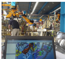
Fig. 2. Point cloud comparison between scan data set and its 3D CAD model

레이저 트래커를 사용하는 캘리브레이션은 기준이 되는 포인트 위치를 지정하기 위하여 로봇 끝단에 반사경을 설치하지만 제안하는 방식은 자동차 차체 판넬과 고정구를 직접 측정하여 기준 포인트를 추출한다. 3D 스캐너를 사용하여 캘리브레이션하기 위해서는 현장에서 스캔한 3D 점군 데이터와 CAD 데이터로부터 추출한 점군 데이터가 필요하다. 먼저 현장의 스캔 데이터는 10m 떨어진 10% 반사율을 갖는 표면에 대해 최대 0.4mm이 내의 거리오차(range error)와 0.009° 각도 분해능을 갖는 상용 3차원 레이저 스캐너(Fig. 1 (a))를 사용하여 Fig. 1 (b)와 같은 고정밀 대용량 3차원 현장 데이터를 획득하였다. Fig. 2는 스캔 데이터와 CAD 데이터를 실시간으로 비교하는 작업을 보여준다.