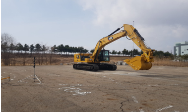
Fig 2. Measurement of the sound power level (Excavator).

배경소음(Background noise)이 낮으며, 주변 50m 이내에 반사물이 존재하지 않는 장소이다. Fig 2.는 굴삭기 소음도 측정 사진이다.