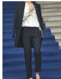
Fig. 3. Son's fashion style in 2016 Seoul fashion week