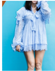
Fig. 5. Park's fashion style in 2018 Seoul fashion week

이같이 서울컬렉션에 참석한 여성 셀러브리티들은 여성미를 자아내는 둥근 어깨선이나 허리 곡선이 강조된 실루엣, 신체의 내부가 투영되는 소재의 부분적인 활용, 레이스나 러플 등의 디테일의 강조, 도트나 플라워 패턴을 매치하여 소녀적이면서도 우아한 또는 관능적인 아름다움이 절충된 여성미를 표출하였다. 이는 신체에서 자아