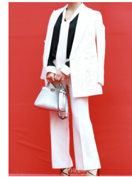
Fig. 2. Jung's fashion style in 2016 Seoul fashion week