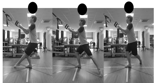
Fig. 2. SEBT exercise