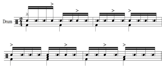
Fig. 4. <Atrás do Trio Elétrico>Drums, Verse 4 Bars

제목에서도 나타나듯 이 작품은 브라질 카니발 리듬을 적극 활용하였다. 프레보는 브라질 북동부에서 파생되어 군악대에서 연주되었던 카니발 리듬 중 하나로, 행진곡의 느낌이 난다. 보통 2/4박자로 쓰이며 업비트에 강세를 주는 것이 특징이다[5]. 다음 Fig. 4를 살펴보면 Verse 부분에서 프레보 드럼의 패턴이 응용되어 나타나는데 악센트가 있는 부분을 제외한 나머지 스네어는 고스트 노트로 작게 연주되었다.