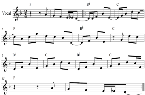
Fig. 1. <Atrás do Trio Elétrico>Vocal, Verse 14 Bars

트리우 일레트리쿠(Trio Elétrico)는 브라질 북동부 지역의 바이아 카니발에서 유래한 것으로 전자 악기의 밴드와 가수가 공연할 수 있는 무대를 갖춘 트럭이나 마차가 행렬하는 것을 지칭한다. 카에타누 벨로주의 <Atrás do Trio Elétrico>에서는 트리우 일레트리쿠에 대한 찬사 내용을 담고 있으며 브라질 카니발 리듬 중 프레보(frevo)의 특징이 돋보인다. 악기는 드럼과 브라질 전통 타악기인 헤코 헤코(reco-reco)와 콩가, 캐스터네츠, 그리고 록 음악의 상징인 전자기타 두 대로 구성되었다.