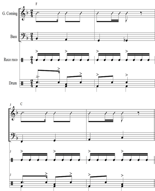
Fig. 5. <Atrás do Trio Elétrico>Intro 4 Bars

Fig. 5는 Intro의 일부를 나타낸 것으로 전자기타 한 대가 프레보의 기본 패턴의 리듬으로 컴핑하고 있다. 그 외에도 브라질 전통악기인 헤코 헤코는 16분음표로만 이