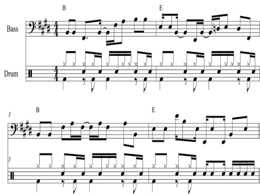
Fig. 8. <Marinheiro só>Verse 2, Chorus

반면 2절 Chorus 부분부터는 베이스와 드럼 중심으로 바뀌면서 곡의 분위기가 고조된다. Fig. 8에서 보이는