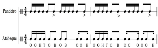
Fig. 7. <Marinheiro só>Percussion Pattern

그러나 록 음악이 더해지면서 악기와 리듬에서는 이전 버전들과 확연한 차이를 보인다. 첫째로 악기는 카포에이라에서 중심이 되는 활모양의 현악기 베림바우(berimbau)를 대신하여 전자기타가 사용되었다는 점이다. Verse 부분에서 드라이브 계열의 오버 드라이브(over-drive) 이펙터를, Chorus 부분에서는 디스토션(distortion) 이펙터와 필터계열의 와우(wah) 이펙터를 사용하고 있다. 이러한 전자기타의 음향효과와 온음계의 보컬 선율과 맞물려 적절한 조화를 이루고 있다. 특히 이 작품에서는 이펙터를 적용한 후 E-G-A-A#-B-D의 E블루스 음계를 사용한 록 스타일의 애드리브를 확인할 수 있었다. 둘째로 작품의 2절 부분에서 본래 카포에이라의 음악적 특징에서 벗어나 록 스타일의 느낌을 주었다는 점이다. 1절 리듬에서는 카포에이라의 전통악기 판데이로와 아타바키(atabaque) 즉, 퍼커션(percussion) 위주로 연주되는 어쿠스틱한 리듬 편곡을 볼 수 있다. 카포에이라 특성상 삼바의 변형 패턴으로 연주된다(Fig. 7).