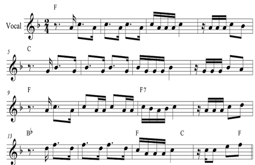
Fig. 2. <Atrás do Trio Elétrico>Vocal, Chorus 16 Bars

Fig. 2의 Chorus 부분의 보컬 선율도 온음계와 각 마디의 화성에 따른 구성음 위주로 이루어졌기 때문에 브라질 전통음악 특징이 잘 나타나 있다. 1마디부터 4마디와 5마디부터 8마디를 보면 4마디 단위로 2도씩 하행한 동행진행의 악구로 구성되어 있음을 알 수 있다.