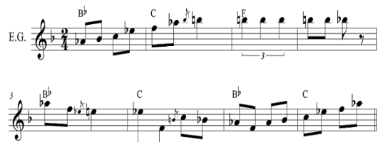
Fig. 3. <Atrás do Trio Elétrico>Electric Guitar 8 Bars

전자기타는 트로피칼리아에서 나타나는 록 음악의 대표적인 특징으로, 카에타누 벨로주는 퍼즈 이펙터(fuzz effector)를 자주 활용하였다. 퍼즈는 주로 기타에서 사용하는 드라이브 계열의 이펙터로 입력된 기타신호가 증폭된 다음 출력의 한계를 넘겨 찌그러진 소리를 만들어 내는 것이다. 이는 신디사이저(synthesizer)의 리드(lead)계열 소리와 비슷하고 대체로 금속성의 느낌이 나기 때문에 화음보다는 단선율에 적합하여 보통 솔로 연주 구간에서 사용된다[8].