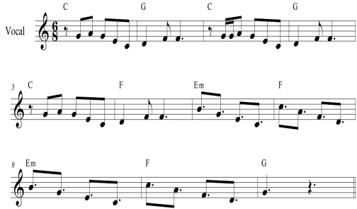
Fig. 10. 〈É proibido proibir〉Vocal, Verse

한편 보컬 선율에서는 앞서 분석한 작품들과 마찬가지로 브라질적 특징이 다분하게 나타난다. Fig. 10과 같이 온음계 사용과 동형진행의 반복으로 복잡한 편곡 속에서 안정감을 준다.