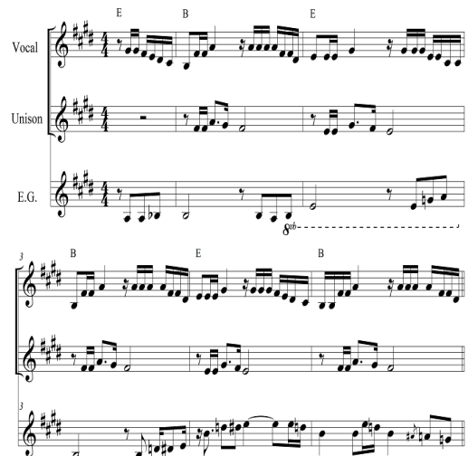
Fig. 6. <Marinheiro só>Chorus 6 Bars

<Marinheiro só>는 카포에이라(capoeira)에 쓰인 음악으로 유명하다. 카포에이라는 브라질 북동부 지역에서 발전된 것으로 브라질 전통악기와 노래에 맞추어 공연하는 브라질 무술이다. 카포에이라에 사용되는 음악은 선율이나 어부, 아프리카계 노예로부터 유래된 인기 있는 민속 음악을 사용하여 탈바꿈하는 경우가 많았는데 <Marinheiro só>가 그 대표적 사례라고 할 수 있다. 카포에이라의 리듬은 삼바에서 유래되었으며 원작자는 존재하지 않고 전통악기뿐만 편성한 라이브로 연주되어 전해 내려왔다[9]. 그러다 카에타누 벨로주의 1969년 벨로주의 화이트 음반에 수록되면서 트로피칼리아로 재구성되었다.