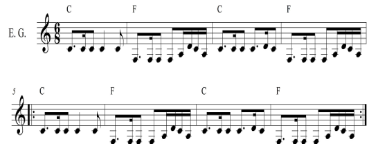
Fig. 9. <É proibido proibir>Electric Guitar, Chorus

이 작품은 트로피칼리아에 참여하였던 록밴드 오스 무탄치스(Os Mutantes)와 함께 작업한 것으로 사이키델릭 록 음악적 요소들이 가미되어있다. 특히 Intro와 Interlude 부분에서는 괴이한 음향효과와 신디사이저 소리, 전자기타, 그리고 전위적인 피아노 선율이 더해져 몽환적인 분위기가 표현되고 있음을 알 수 있다. 또한, 이펙트 심벌(effect-cymbals) 중 록 음악이나 헤비메탈에서 자주 볼 수 있는 차이나 심벌(china-cymbal)도 등장하면서 몽환적인 분위기에서 갑작스럽게 충격을 주는 효과도 포함되어 있다.