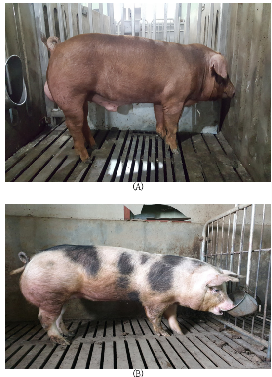
Fig. 1. (A) Duroc (B) Crossbred(Duroc×Pietrain×Pietrain) pigs

실험에 사용된 사료는 돼지 검정사료(농림축산식품부 고시 제2018-63호) 기준에 준하여 배합하였고, 사양관리는 돼지 검정방법(농림축산식품부고시 제2018-3호)에 준하여 실시하였다.