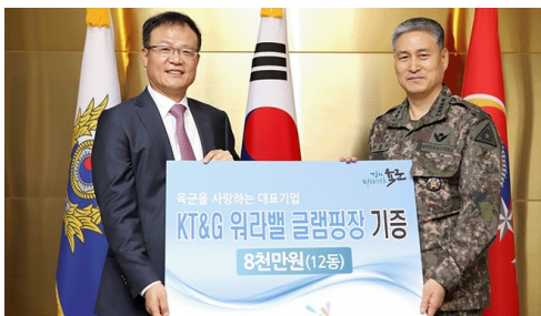
Fig. 1. Company's support for ROK Army WLB policy

군에서도 상급 추진계획을 실행한 배경은 다음과 같다. 첫째, 장교 중심으로 진급에 관심을 두고 개인과 가정의 생활을 어느 정도 포기할 수 밖에 없는 계층구조문화가 군 내에 뿌리 깊게 자리 잡고 있다. 둘째, 인원에 비해 과중하게 제공되는 업무량과 이로 인한 스트레스로 삶의 질을 고려할 여유가 부족하다. 셋째, 군 내부적으로 수십 년 동안 일-휴식의 조화를 강조한 바 있지만, 일시적인 이벤트에 머물렀을 뿐 지속 가능한 문화로의 정착이 부족하였다. 마지막으로 상급자의 솔선수범이 부족하였고, 하급자들은 상급자의 눈치보기를 할 수 밖에 없는 계층문화가 원인으로 작용하였다.