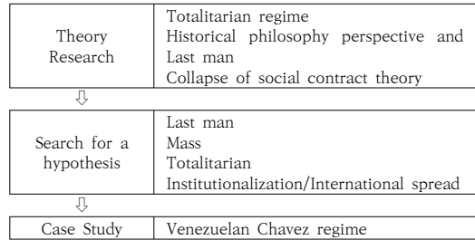
Fig. 1. Study Design

이러한 연구 목적의 달성을 위하여 <그림 1>과 같이 이론적 논의, 가설의 모색, 그리고 사례를 통하여 분석하고자 한다. 사례로는 논란을 줄이기 위해 보편적으로 독재적인 유사전체주의의 형태를 보이고 있는 베네수엘라의 차베스 정권을 선정하였다. 이러한 논의들을 통하여 이론적, 정책적인 함의를 도출해 보고자 한다.