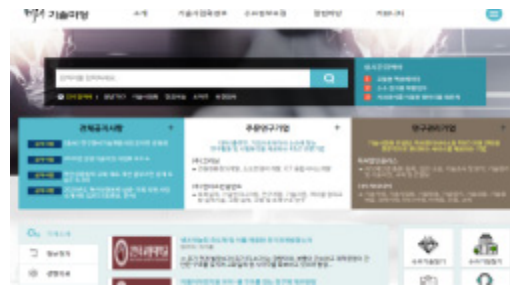
Fig. 2. COMPA Future Technology Zone Operation Site

기술정보 플랫폼은 기업과 연구자, 운영주체간의 역할 분담을 통한 정부의 질과 양의 관리가 중요하기 때문이다.