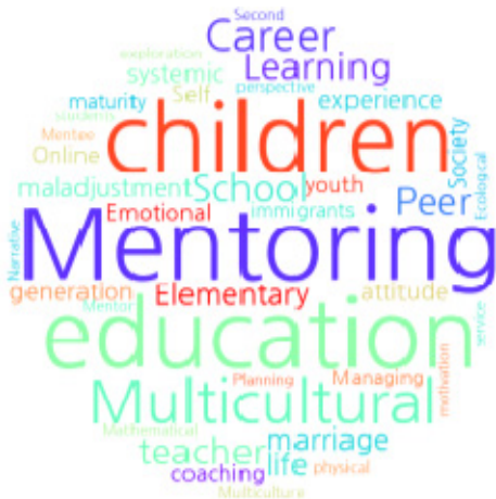
Fig. 2. Word cloud of keywords

(17.5%), ‘다문화아동’이 4편(10.0%), ‘다문화교육’이 2편(5.0%), ‘동료멘토링’이 2편(5.0%)으로, 그 외 주요어 25개는 개별 연구마다 상이하다. 중재 대상자(멘티)로는 다문화가정의 아동이 2편(22.3%), 초등학생이 6편(66.7%), 중학생과 고등학생이 함께한 연구가 1편(11.1%)으로, 대상자 수를 알 수 없는 연구 1편을 제외한 총 대상자 수는 589명이었다. 중재 제공자(멘토)로는 초등학생이 1편(11.1%), 고등학생이 2편(22.3%), 대학생이 6편(66.7%)으로, 제공자의 수를 알 수 없는 연구 4편을 제외한 총 제공자 수는 123명이었다. 중재와 관련하여 선택연구 9편 모두에서 개별적인 멘토링을 제공하였고, 3편의 연구에서는 개별적인 멘토링과 함께 공동체 야외 체험 학습 활동, 진로탐색 프로그램, 야외 캠프 활동이 수행되었다. 중재는 5~28주의 기간에 15~36회기, 각 회기당 60~480분간 적용되었다. 연구의 결과로는 멘토링 프로그램의 만족도, 경험, 학습동기, 자기효능감, 평가, 학습능력, 진로성숙도, 학교부적응, 수학학습태도 등이 연구되었다(Table 2)(Fig. 2).