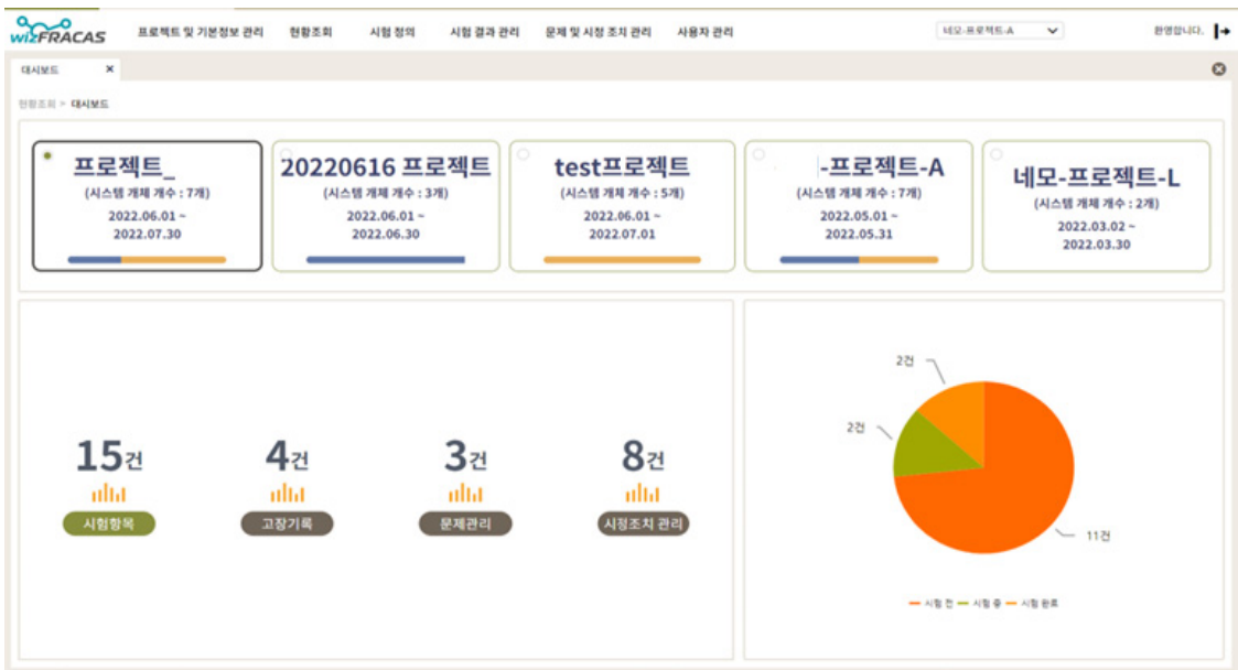
Fig. 4. Status inquiry_dashboard