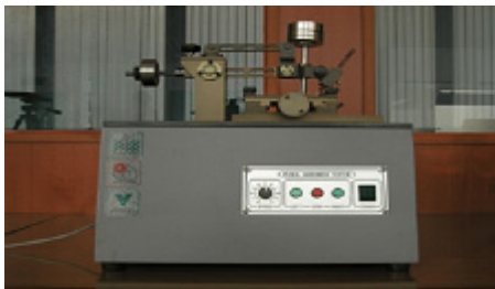
[그림 3] 연필경도 테스트 평가방법

경도는 연필경도 측정기로 KS M ISO 15184에 기준하여 PVC Tile 표면에 45도 각도로 규정된 연필의 심을 대고 500g의 하중으로 5회 왕복 후 긁힘 정도에 따라 평가하였다.