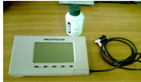
[그림 4] 코팅두께 테스트 평가방법

코팅두께의 측정은 초음파 multi-layer 코팅 두께 측정기(미국, Defelsko, positector ® 100)로 5회 측정 후 평균값으로 평가하였다.