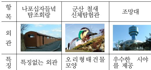
[표 3] 군산 금강 조류 공원

있는 새의 관찰에 있어서 매우 우수한 시야를 제공한다. 그러나 건축 디자인적 관점에서 보면 독창성과 예술성에 있어서 낮은 점수를 줄 수 밖에 없다. 그리고 강가에 설치한 탐조회랑은 원목을 재료로 사용하여 자연친화적인 느낌을 의도한 듯 보이나 실제로는 주변 자연경관에 이질적인 인공 건축물로서 도드라지고 있음을 볼 수 있었다. 표면의 처리와 색채계획에 있어서 좀 더 자연에 융화하는 디자인을 고민하였어야 한다고 본다. 표 3은 공원의 외관이다.