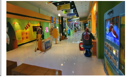
[그림 3] 전시평면계획안 [그림 4] 전시관 내부