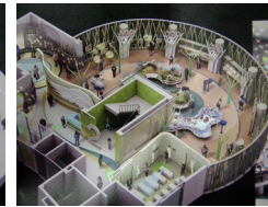
[그림 5] 1층실내공간 [그림 6] 금강홀 CG

1층 실내는 금강홀이라 명명하였고 2층 에코라운지에는 디오라마를 중심으로 금강의 생태를 재현하였다. 3층은 철새의 생태를 체험하는 공간으로 계획하였다. 전체 3개 층의 전시공간으로 구성된 서천 조류 생태 전시관은 앞에서 다른 2개 전시관에 비하여 전시의 내용에 있어서 다양함을 볼 수 있다. 전시 공간 영역별 전시내용을 정리하면 다음의 표와 같다.