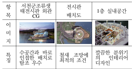
[표 5] 서천 조류 생태 전시관 이미지

건축적으로 살펴보면 기존의 마감(드라이비트)을 유지한 상태에서 그 위에 시공하는 건식공법(베이스 패널)을 도입하여 공기 단축 및 시공성을 향상시켰다. 기존의 원형매스 부분은 일부 철거 후 재시공을 통해 원뿔 형태로 변형함으로써 입면의 변화를 추구하며 전면 입면을 커튼월로 처리하여 외관의 맑고 투명한 이미지를 줌과 동시에 실내에서의 조망을 좋게 하였다. 커튼월과 더불어 외관에 목재 루버를 써서 철새에게 주는 영향을 줄이고자 하였다고 한다.