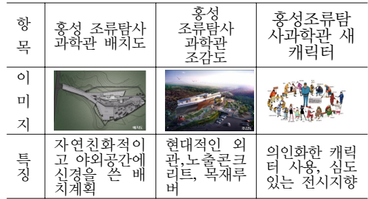
[표 4] 홍성 조류 탐사관 이미지

2009년 4월 개관하여 운영 중인 전시관은 대지면적(9,133.00㎡), 건축연면적(1,465.78㎡), 전시면적(875.9㎡)의 규모이다. 지상 2층의 건물로 옥외 면적 약 8000㎡이다. 건축적으로 보면 외관은 노출 콘크리트와 로이 글래스 그리고 목재 루버를 사용하여 앞서 군산의 철새조망대와는 비교된다. 추상적인 기하학적 형태와 현대적인 재료와 공사방법을 사용하여 현재 유행하는 트렌드를 따르는 것으로 볼 수 있다. 홍성 톨게이트에서 지역 관광 명소인 안면도를 향해 가는 도로변에 입지하는 만큼 관광객의 휴식공간으로서도 그 기능을 연장하고자 하는 의도가 있으므로 세련된 외관은 적절한 디자인 방향이라고 생각된다. 그러나 본연의 새의 관찰이라는 관점에서 보면 입지에 있어서 바닷가를 직접적으로 면하지 못하고 도로를 넘어 바다의 시야가 펼쳐지는 단점이 있다. 그리고 휴게 공간이라면 적절하다고 볼 수 있는 건물의 외관도 철새를 불러들이고 그들을 방해하지 않고 관찰한다고 하는 조류 탐사관의 본연의 기능에 있어서는 적합하지 않을 수 있는 문제점을 목재 루버를 전면 벽체에 폭넓게 설치하여 콘크리트의 이질감을 상쇄하고자 한 의도를 읽을 수 있다.