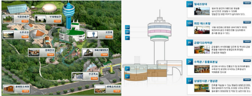
[그림 1] 공원 조감도 [그림 2] 전망대공간구성

90%(50만 마리)가 이곳을 찾는다고 한다. 전시물에 있어서는, 가장 먼저 완성된 전시관이다 보니 전시의 기술적인 부분에서 다른 두 전시관에 비하면 뒤쳐지는 면이 있다. 그림 1과 그림 2는 공원의 공간 구성을 보여준다.