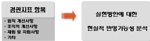
[그림 4] 경관관리 실현방안 분석도

각 제시된 개선방안의 실제적인 적용 가능성을 알아보려는 실용성 분석은 사안과 여러 여건변화에 따라 기준을 설정하기에는 무리이지만, 현재적 수준(제도 및 조건 등)에서 가능성을 평가한다.