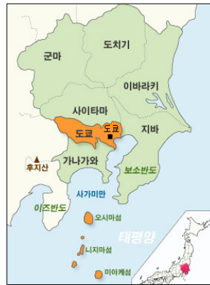
[그림 1] 도쿄의 입지 [Fig. 1] Tokyo's location

일본은 제2차 세계대전을 겪으면서 도시 전체가 폐허로 변했지만, 1950년 한국 전쟁이 일본 경제에 특수를 가져왔고 도쿄는 빠르게 회복되었다. 이후 엄청난 속도로 인구가 유입되어 1955년에 인구 8백만을 육박했고, 1962년에는 천만의 시대가 도래하였다. 한편, 지나친 인구집중 현상을 줄이기 위해 다양한 정책이 등장하였고, 핵도시 육성 등 위성도시 개발로 잠시 도쿄의 인구가 주변으로 이주되었지만, 1990년대 말 다시 도심부의 재개발에 따라 인구가 도쿄로 이주하고 있다. 20세기로 접어들면서 100년간 일본의 인구는 약 3배로 증가하여, 도쿄는 인구 약 1,300만명으로 이루어진 세계최대의 거대 도시권으로 성장하였다. 그러나 향후 일본의 인구는 저출산의