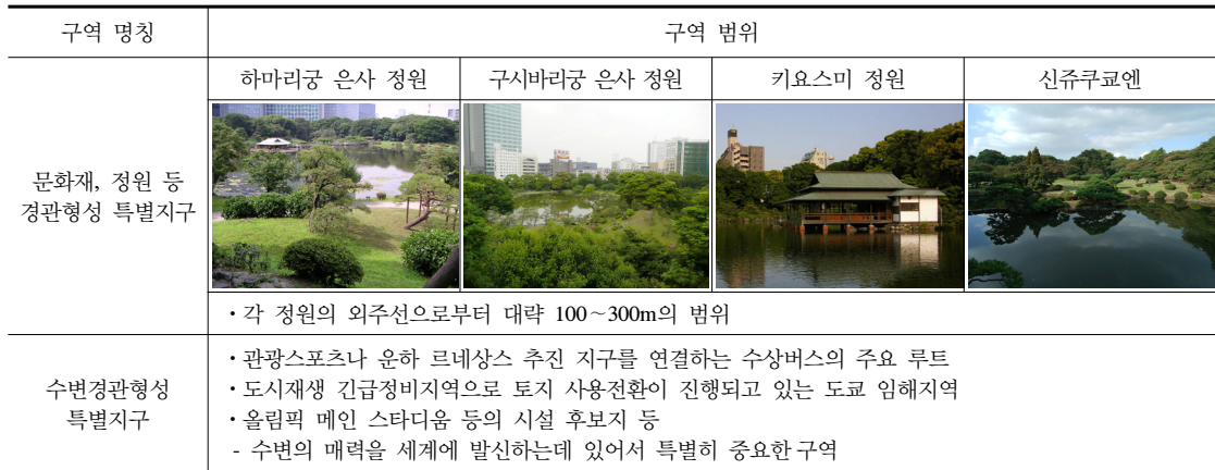
[Table 4] Color-scape area range of special landscape district

대체로 차분함이 있는 색채분위기가 나타나고 있다(그림 5). 그리고 구시바리궁 은사 정원 주변은 상업, 업무기능의 고층건물이 밝고 온화한 가로경관을 형성하고 있으며, 키요스미 정원 주변도 다양한 용도에 비해, 통일감 있는 색채가 형성되고 있다.