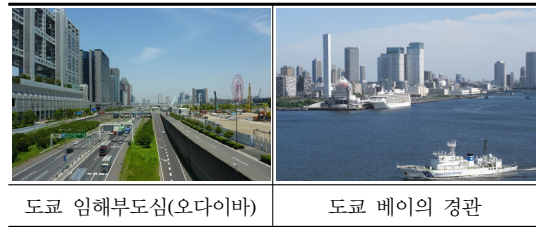
[그림 6] 수변경관형성 특별지구의 색채형성 [Fig. 6] Color formation of special waterfront landscape district

은 대체로 밝은 저채도색을 유도함으로써 수변경관에 어울리는 개방적인 분위기를 창출하고 있다.