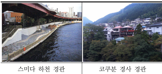
[그림 4] 경관 기본축 구역의 색채형성 [Fig. 4] Color formation of basic landscape axis

하천계에 해당하는 스미다 하천 경관 기본축의 경관은 도쿄만과 이어지는 하구부에 아사쿠사, 구라마에 등의 번두리 경관들로 형성되어 있다. 천변 주위의 건축물 색채 환경은 저채도색의 따뜻한 분위기를 나타내는 난색계열의 색이 주로 사용되어 전체적으로 편안한 분위기로 나타나지만, 일부 건축물과 고가도로, 제방 등의 대형 구조물에 원색계열의 자극적 색채가 사용되어 주위와 조화감이 떨어지는 경우도 나타난다(그림 4).