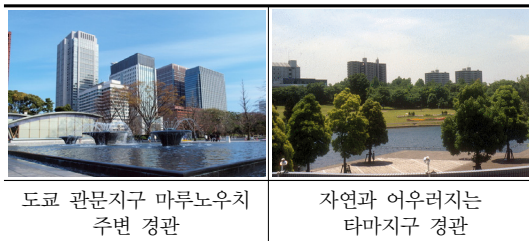
[그림 7] 일반지역의 색채형성 [Fig. 7] Color formation of general area

그리고 타마지구에는 뉴타운 개발 이전에 존재했던 싱그러운 자연과 풍부한 녹지공간을 가능한 한 원형 그대로 유지한다는 원칙 아래 공원을 배치하고, 자연식생과 조화되는 택지조성이나 경사지를 활용하는 주택건설 등을 통해 자연생태계의 훼손을 최소화시키면서도 ‘자연이 풍부한 생활공간’을 창조하고 있다[8].