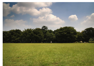
[그림 2] 이노카시라온시 공원 (井の頭恩輝公園) [Fig. 2] Inokashiraonsi park

도쿄는 에도 관청을 설치한 이래 400년의 긴 역사와 전통 위에 쌓아 올려진 세계 유수의 대도시이다. 특히, 도쿄에는 우쿠타마의 산들이나, 계곡, 신록, 이노카시라온시 공원, 무사