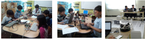
[그림 5] 프로그래밍 학습 장면 [Fig. 5] Programming Learning scene

적용대상 학생들의 평가는 두 그룹으로 나누어 1학기 동안 진행하였다. 한 그룹은 프로그래밍 학습을 위해 로봇을 적용하지 않고 컴퓨터를 기반으로 하였고 다른 그룹은 본 연구에서 설계된 로봇을 적용하여 프로그래밍 학습을 진행하였다.