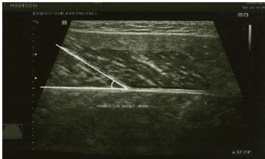
[그림 1] 내측 비복근 우상각 측정 [Fig. 1] Measurement of medial gastrocnemius pennation angle

영상에 저장한 후 caliper 프로그램을 통하여 각도를 측정하였다. 영상을 촬영하는 동안 대상자는 침대에 엎드려 무릎관절을 편 상태로 종아리가 침대 모서리 밖으로 나오게 하였다[18]. caliper 프로그램을 통한 calibration 과정은 대상자가 족관절을 최대 등척성수축 하는 동안 영상에 나타나는 내측 비복근의 하층막과 일치하는 선을 긋고, 근육의 수축 정도에 따라 달라지는 섬유속을 따라 선을 그어 두 선을 연결하여 자동적으로 각도를 측정하였다[그림 1].