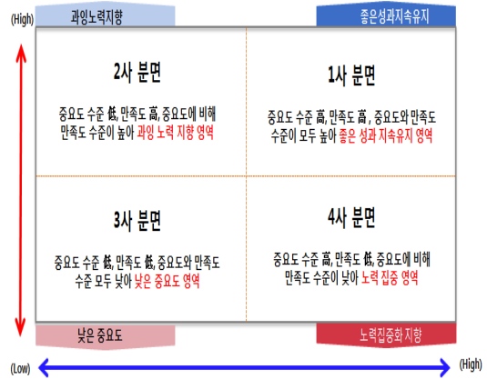
[Fig. 1] Importance- Performance analysis Matrix

분석틀을 바탕으로 본 연구에서는 전공지식과 직업기초능력에 대한 졸업생들의 역량중요도, 실행도, 대학기여도의 차이를 분석하고 결과를 도출하여 전문대학에서 직업기초능력함양을 위한 교육과정을 운영하는 데 있어 실제적인 근거자료를 마련하고 교육과정 개선의 방향성을 제고하고자 한다.