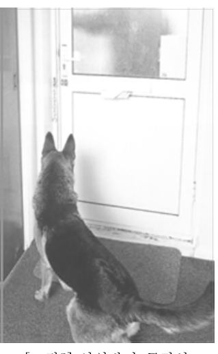
[그림8] 영역방어 공격성

자료: "Dogs Behaving Badly", "What Is My Dog Thinking", Gwen Bailey, 2004년