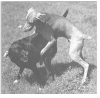
[그림6] 우위적 공격성