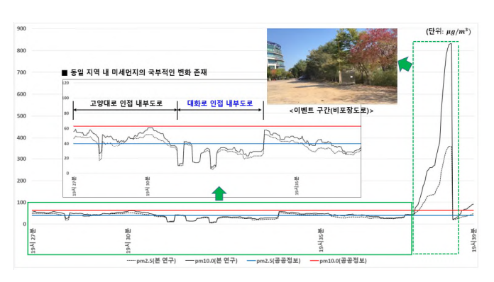
[그림 4] 현장 테스트 결과(10월 21일, 미세먼지"나쁨")