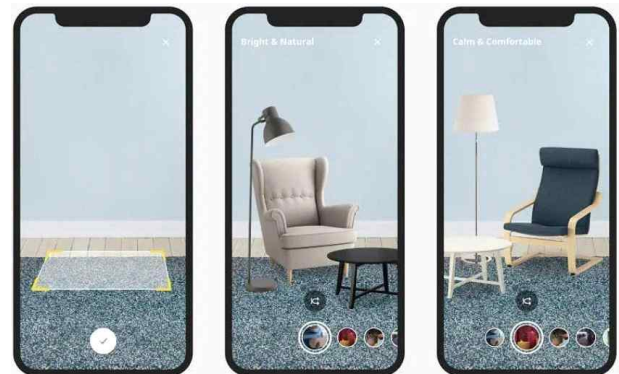
[그림 3] 이케아 플레이스

DIY가구로 유명한 이케아는 이케아 플레이스를 통해 사용자가 증강 현실 속에서 가구나 기타 이케아의 제품을 배치하고나 시험해 볼 수 있도록 한다. 이케아 플레이스는 방과 가구의 크기를 비교하여 98% 정확도로 사용자가 최상의 결정을 내릴 수 있도록 도와주며 사용자의 환경에 이케아의 제품이 잘 어울릴 수 있는지 확인할 수 있다. 사용자는 피지털 디자인 경험을 통해 디지털매체와 물리적 환경을 경험할 수 있다.