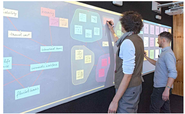
[그림 2] 호이루의 스마트 월

오스트리아의 호이루는 대화형 디스플레이를 통해 팀원들 간에 효율적으로 함께 일할 수 있는 스마트 월을 발표하였다. 스마트 월은 개인 장치 및 간단한 펜과 함께 작동하며 CVR 장치용 솔루션을 제공한다. 펜은 다양한 크기로 조절이 가능하고 쉽게 쓰고 지울 수 있다. 회의에 많이 사용하는 포트스잇 기능은 문장의 길이에 따라 크기가 자동으로 전환되며 문자들은 그룹화하여 크기를 크고 작게 조절할 수 있다.