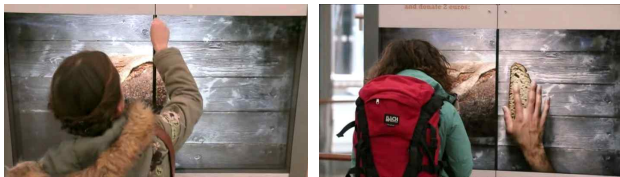
[그림 1] 미저레오스의 소셜 스와이프

소셜 스와이프는 독일 자선단체 미저레오스가 피지털 디자인을 도입해 만든 인터랙티브 기부 광고이다. 유동인구가 많은 함부르크 공항에 장치를 설치된 커다란 평면 모니터에는 빵이나 бат줄에 묶인 누군가의 손 그리고 그 위에 'Free Them'이라는 문구가 적혀 있다. 빵 또는 묶인 손 사이에는 카드 리더기가 설치 되어 있으며 모니터 중앙의 틈새로 신용카드를 통과시키는 간단한 동작 한번으로 빵이 잘라져 굽고 있는 페루 가족의 하루 분량의 양식이 마련되기도 하고 불합리하게 필리핀 감옥에 수감되어 있는 아이들을 감옥으로 해방시켜 줄 수 있다. 피지털 디자인으로 구성된 소셜 스와이프는 한번에 2유로의 금액을 손쉽게 기부할 수 있다.