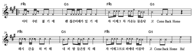
[그림6] Come Back Home-BTS Pre-chorus

전주는 원곡과 달리 16마디로 구성하였다. 기존에 무거운 베이스라인으로 시작되었던 4마디에 4마디를 더 추가하여 대중들이 열광하던 부분을 더 길게 즐길 수 있게 하였다.