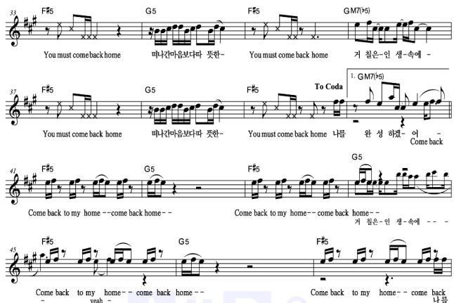
[그림6] Come Back Home-BTS 후렴

후렴 부분 전에 원곡에서는 볼 수 없었던 Pre-chorus 파트를 삽입하였다. 이는 후렴 부분 전에 긴장감을 조성하고 후렴을 강조하는 효과를 준다. 뿐만 아니라, 곡에 걸맞은 가사를 추가하여 대중에게 전달하고자 하는 메시지를 더욱 명확하고 풍부하게 표현하는 효과 또한 볼 수 있다.