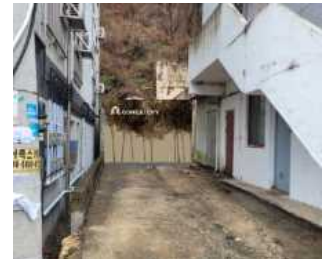
[그림 2] 가림막 적용 시안