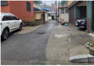
[그림 4] 부분보수로 인한 이질적 바닥