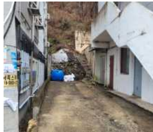
[그림 1] 야산 연결 통로 현황