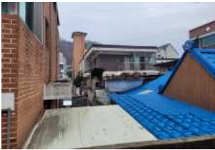
[그림 6] 보행로에서 지붕으로 접근 가능 부위