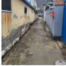
[그림 5] 지지분한 마감 상태