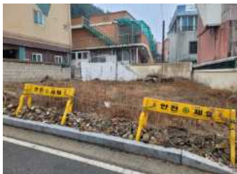
[그림 7] 방치된 폐가 공터