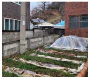
[그림 7] 노후 담장

이 되는 범죄예방디자인의 이론적 적용과 더불어 사용자의 요구를 수렴하고 현장 방문을 통해 개선안을 제시하고자 한다. 노후화된 마을의 환경 개선에 있어서 범죄예방 디자인의 필요성은 매우 큰 것이 사실이나 이에 앞서 공공 공간의 품질과 관리가 우선적으로 공간의 인상을 좌우하므로 사업 범위 내의 바닥과 벽면의 통일성 있는 개선을 우선해야 할 것으로 판단된다.