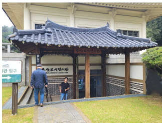
[그림 3] 한산모시 전시관 입구