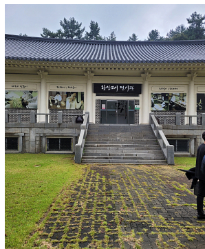
[그림 4] 현재 출구