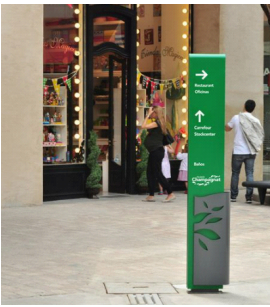
[그림 1] 방향 사인물