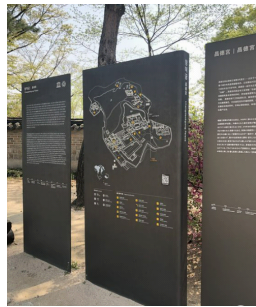
[그림 2] 배치도 사인물